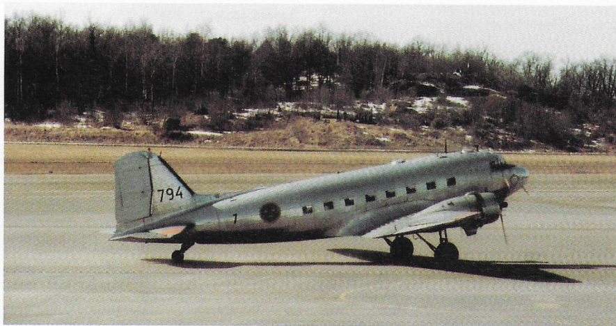
OY-DDY fløj i det svenske Flygvapens bemaling fra oktober 1952 til april 1984. Flyets videre skæbne i Zaire er ukendt.

Sidste flyvning fandt sted den 13. august 1981, hvorefter det blev opmagasineret indtil april 1984, hvor det blev solgt til Transport Aeriens Zaire som 9Q-CYE, og forlod Bromma ved Stockholm den 22. april 1984.