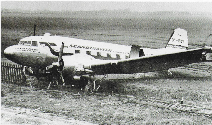
Landingshavari på Bultofta ved Malmø den 8. februar 1950. Som det fremgår af billedet blev flyet stoppet af en grøft og et hegn. Bemærk den beskadigede venstre vinge. Efter endt reparation var det i luften igen den 20. april s.å.